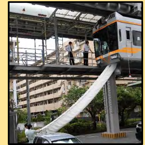
非常用脱出袋 （脱出用シューター）