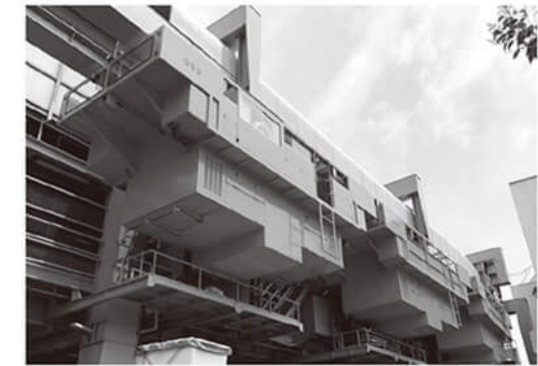
軌道点検車(きどうてんけんしゃ)

ロボットみたいな軌道点検車 東海道・山陽新幹線の“ドクターイエロー”のように、湘南モノレールでも、毎日の安全走行のために軌道点検車が走っています。こちらは、スマートなモノレールとは違って、ごっこつしたロボットのような車体。実物は黄色です。